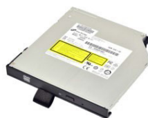
Съемный DVD Super Multi